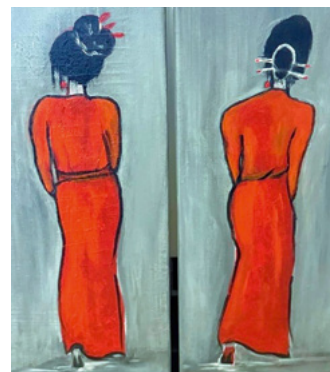
Die Motive für ihre Bilder entstehen oftmals spontan oder durch besondere Ereignisse.

Neben Porträts bekannter Persönlichkeiten hat sie in den letzten Jahren auch andere Motive wie Bäume, Natur und das Meer mit Acrylfarbe auf die Leinwand