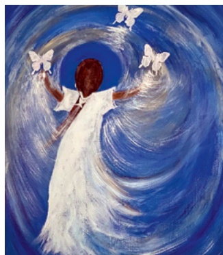
„Tanz durch die Zeit“ ist der Titel der aktuellen Ausstellung von Bärbel Spieshöfer.

in der Alten Vogtei unter dem Titel „Tanz durch die Zeit“ präsentiert. Es ist ihre erste Einzelausstellung. In Gemeinschaftsausstellungen mit anderen Kunstschaffenden aus dem KunstKarree Bünde hat sie ihre Arbeiten schon öfter einer größeren Öffentlichkeit gezeigt. Besondere Aufmerksamkeit erhielten die Kreativen, als sie die Stadt Bünde bei der Verschönerung der Stromverteilerkästen mit Bündler Motiven unterstützten. Noch heute besucht sie regelmäßig das Bündler Atelier, um sich mit den anderen Künstlerinnen und Künstlern auszutauschen,