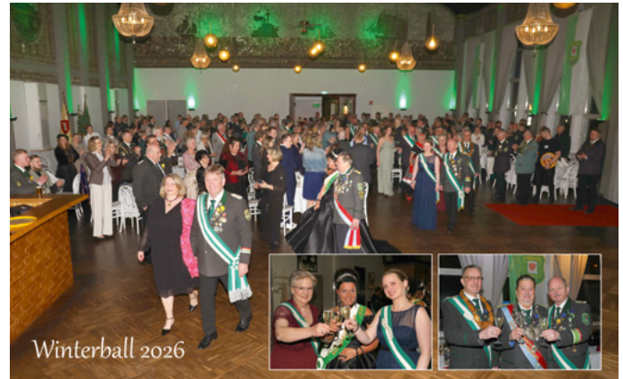
Winterball 2026 Viele Besucherinnen und Besucher genossen die gute Stimmung beim diesjährigen Winterball der Heeper Schützengesellschaft.