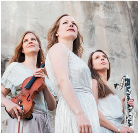
Das Trio Luz y Sombra präsentiert in der Peter-und-Pauls-Kirche sein Programm „Encuentro“: Hier trifft Piazzolla auf Bach, Bartók und Boulanger und der Tango auf Jazzelemente.