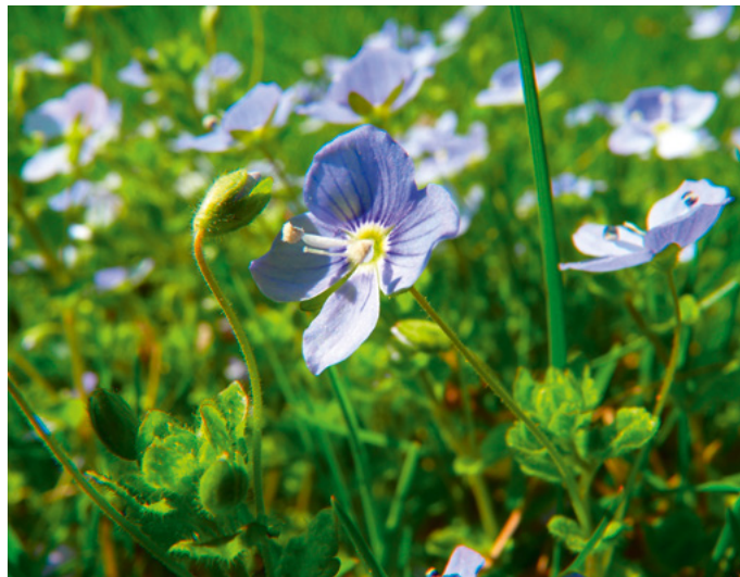
Den Ehrenpreis findet man in Gärten, auf Äckern und Schuttplätzen, auf Wiesen, an Wald- und Wegesrändern.

Viel Vergnügen beim Ehren-preis-Kennenlernen wünscht