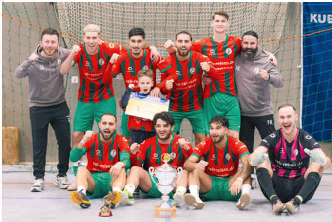
Sieger des Turniers war der VfB Fichte.

Heepen zum Hallenfußball-Turnier um den Pokal der Bezirksvertretung Heepen eingeladen. 20 Teams nahmen an dem beliebten sportlichen Event teil. Das Turnier begann mit einer