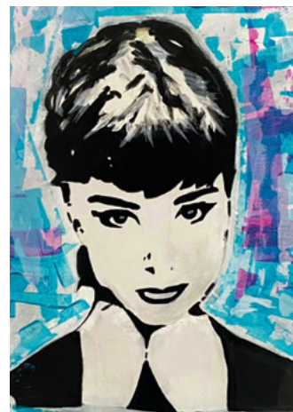
Porträt der Schauspielerin Audrey Hepburn

Die Ausstellung in der Galerie in der Alten Vogtei beginnt am 11. März und ist bis zum 30. April zu sehen. Sie hat täglich von Montag bis Freitag von 16.30 Uhr bis 22 Uhr geöffnet.