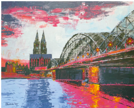
Die Hohenzollernbrücke in Köln