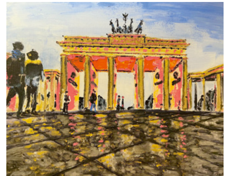
Das Brandenburger Tor in Berlin