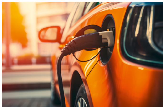
Die Sparkasse Bielefeld baut die Ladeinfrastruktur gezielt aus.

Ein zentraler Aspekt des Projekts ist die konsequente Ausrichtung auf Nachhaltigkeit. An allen Standorten wird ausschließlich Ökostrom bereitge-