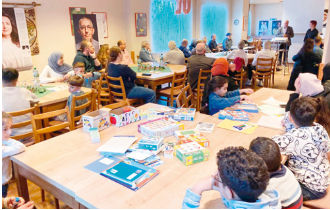
Im November letzten Jahres wurde das zehnjährige Jubiläum des Vereins Altenhagen weltweit gefeiert.

zunächst per Arbeitsvisum in Bielefeld und später in Köln tätig war, aber trotz sehr guter Zeugnisse keine Arbeit finden konnte, weil seine Deutschkenntnisse nicht ausreichend waren. Altenhagen weltweit unterstützt durch Deutsch-Einzelunterricht und die Weitergabe von Hilfsangeboten.