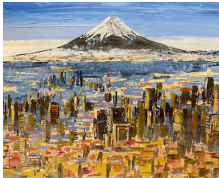
Der Berg Fuji in Tokio